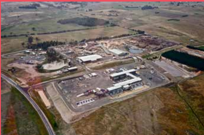
韩国木材加工企业东和控股通过对新南威尔士州的投资创造了87个工作岗位。

新州政府欢迎来自亚洲各国的投资，并能在公司创办以及业务发展方面为各企业提供一系列的服务和帮助。