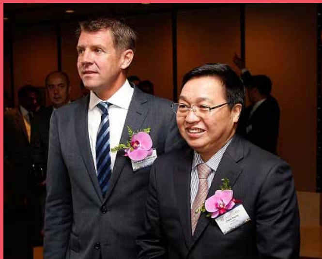
新南威尔士州州长麦克·贝尔德议员以及中国银行行长陈四清出席了澳大利亚悉尼人民币结算中心的启动典礼

新南威尔士州已经为人民币交易中心的大发展做好了充足准备。新州已具备了所有的关键要素，包括贸易往来领域的政府协助、监管部门的支持、各种行业产品、各种专业网络，以及大力支持这项机遇的众多金融业翘楚。在进入澳大利亚的61家外国银行当中，有57家将其总部设在了悉尼。